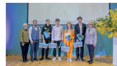
0-33 grupa kvalifikācija "Ceļu būvtehniķis"