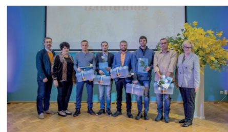
01 grupa kvalifikācija "Krāšņu un kamīnu mūrnieks"