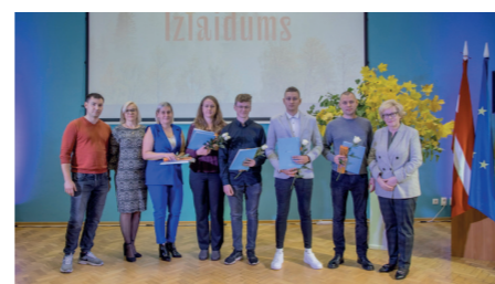
0-23a grupa kvalifikācija "Inženiersistēmu būvtehniķis"