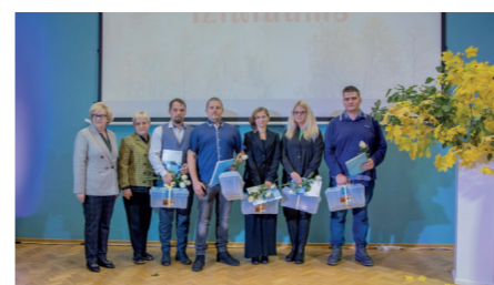
0-33G grupa kvalifikācija "Ģeotehnikas izpētes tehniķis"