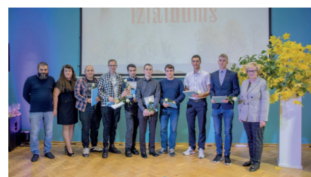
02a grupa kvalifikācija "Automehāniķis"