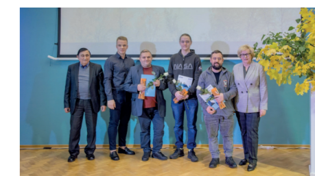
0-23S grupa kvalifikācija "Siltumapgādes un apkures sistēmu tehniķis"