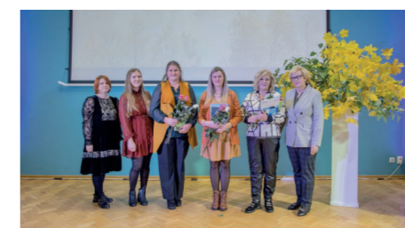
08a grupa kvalifikācija "Ainavu būvtehniķis"