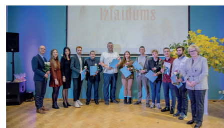
02T grupa kvalifikācija "Transportlīdzekļu krāsotājs"