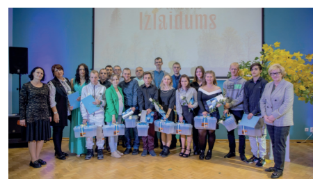
0-15a grupa kvalifikācija "Apdares darbu tehniķis"