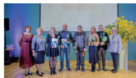
V-062 grupa kvalifikācija "Augskopības tehniķis"