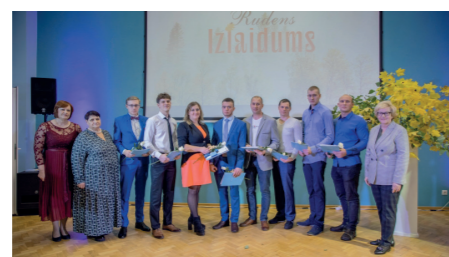
V-052 grupa kvalifikācija "Lauksaimniecības mehanizācijas tehniķis"